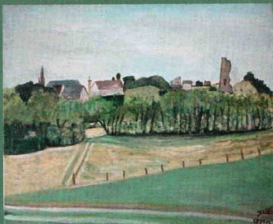
Mondoubleau. La Journée des Peintres

Voci ce qu'il a bien voulu répondre à nos questions.